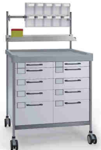
3942 W N365 W.26(RA5N.A5.R1N)