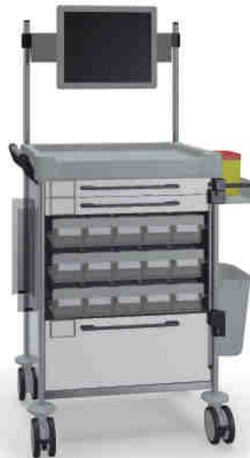
1828 W 110M6TX W.26M(R75M).32R.46.50