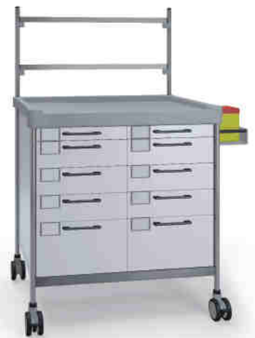
3840 W N365 W.26(R7N.R7N).32NR