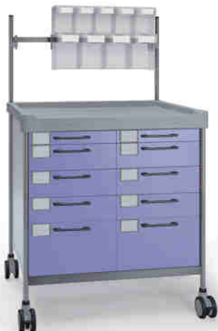
3928 F N365 F.26(RA4N.A5)