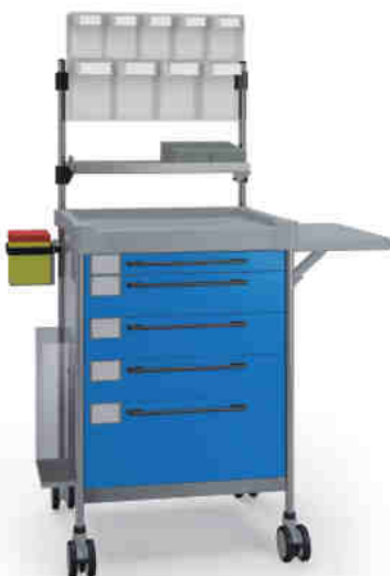
3687 B 365 B.26(RA4.A5.R2).30.33L.44L