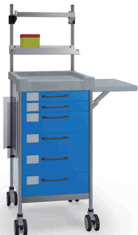
Q078 B SQ061 B.26(R2Q.R1Q).30.46