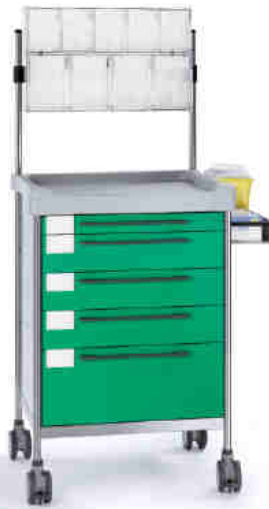
3607 G 365 G.26(RA4.A5).32R