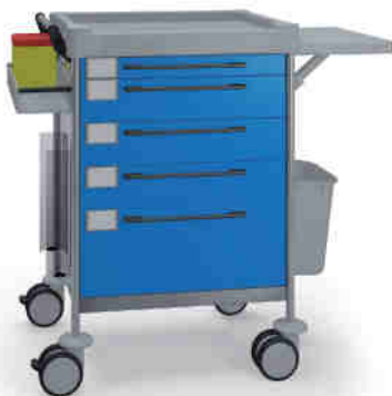
1642 B 165 B.30.32L.46.50