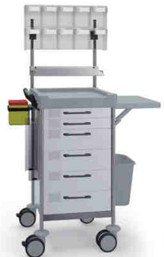
Q158 W SQ161 W.26(RA5Q.A5.R1Q). 30.33L.46.50