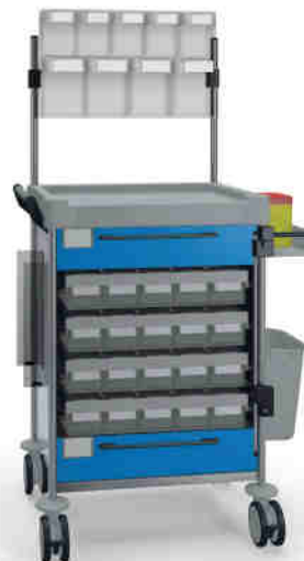
1895 B 114M6 B.26(RA4.A5).32R.46.50