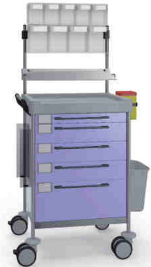
1638 F 165 F.26(RA4.A5.R1).33R.46.50