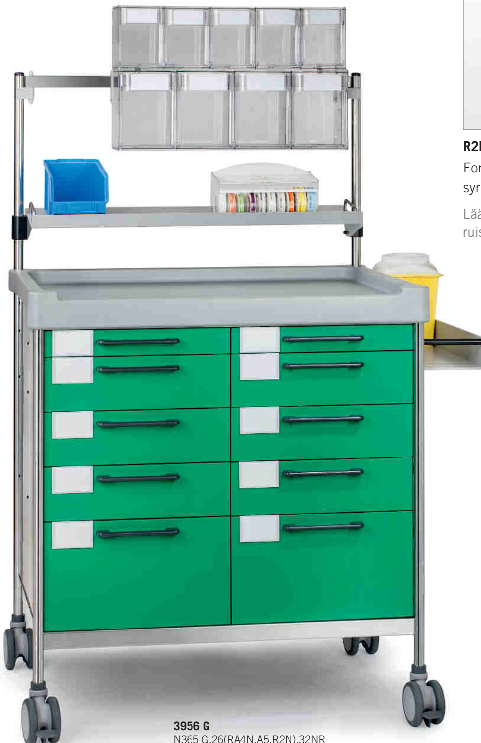
3956 G N365 G.26(RA4N.A5.R2N).32NR

Lääkkeiden etiketit, ruiskujen tunnistaminen