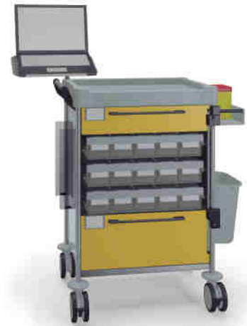
1813 Y 112M6 Y.27.32R.46.50