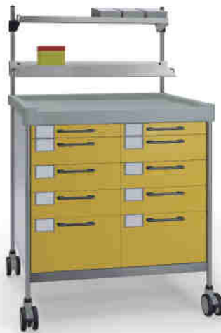
3830 Y N365 Y.26(R2N.R1N)