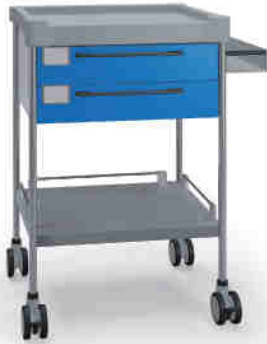
3102 B 322 B.32R