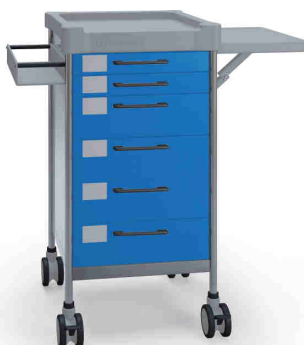
Q072 B SQ061 B.30.32L