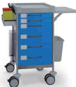
Q142 B SQ161 B.30.32L.46.50