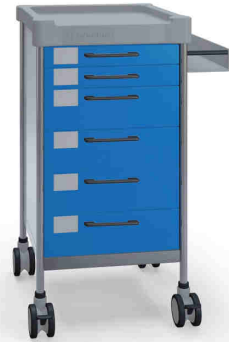
Q054 B SQ061 B.32R

Without keyboard drawer Ilman näppäimistövetolaatikkaa