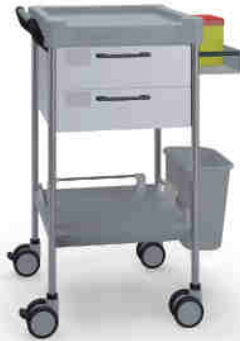
Q605 W SQ022 W.AST.32R.50 Wheels Pyörät Ø 100 mm