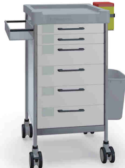
Q063 W SQ061 W.32L.33R.50