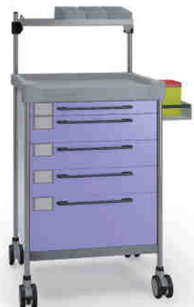
3135 F 365 F.26LW(R2).32R