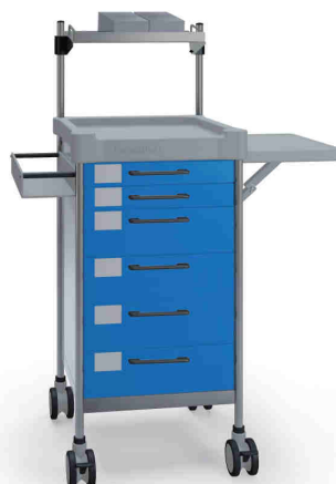
Q073 B SQ061 B.26LW(R2Q).30.32L