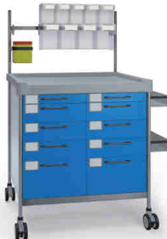
3934 B N365 B.26(RA4N.A5).(2)32NR.33L