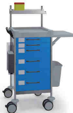
Q150 B SQ161 B.26LW(R1Q).30.46.50