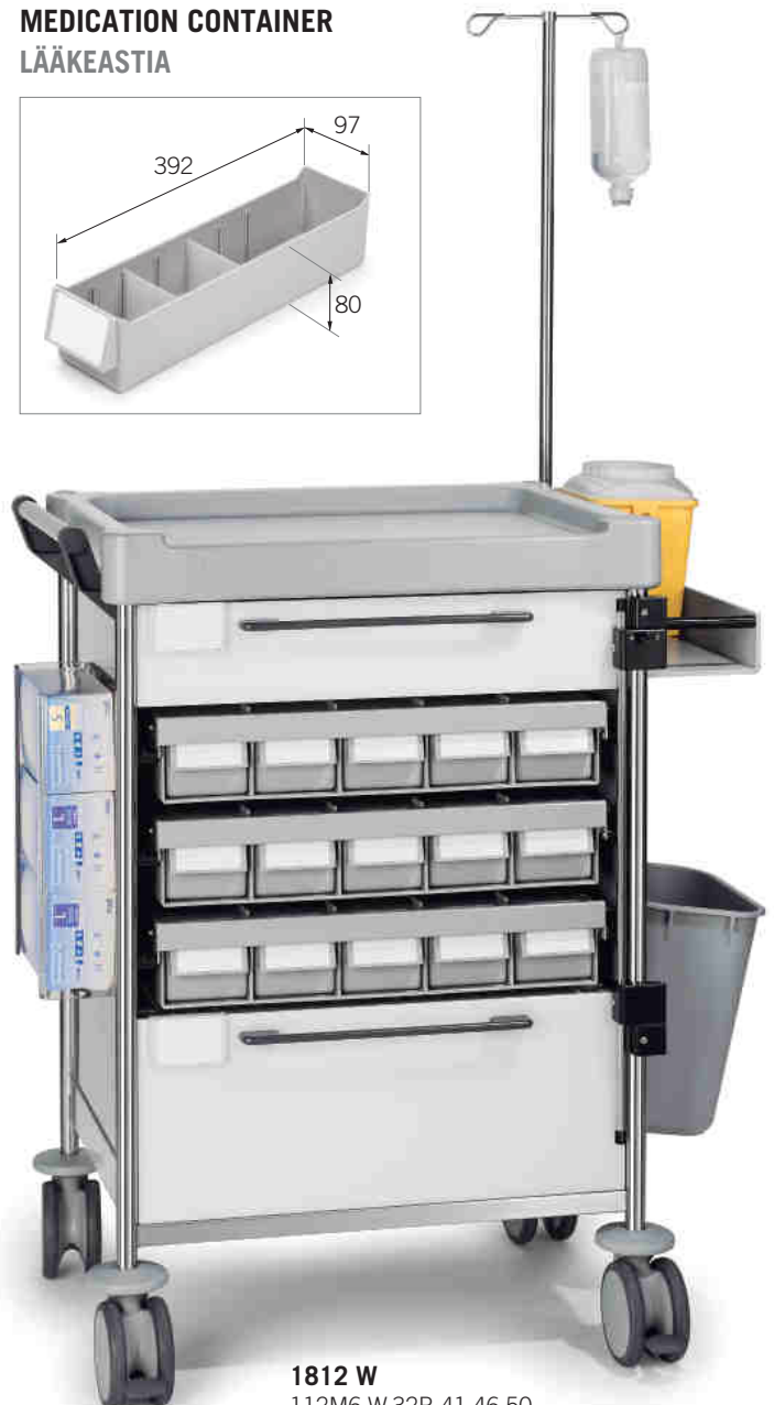
1812 W 112M6 W.32R.41.46.50