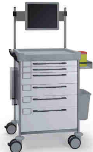
1690 W 162M6TX W.26M(R75M).32R.46.50