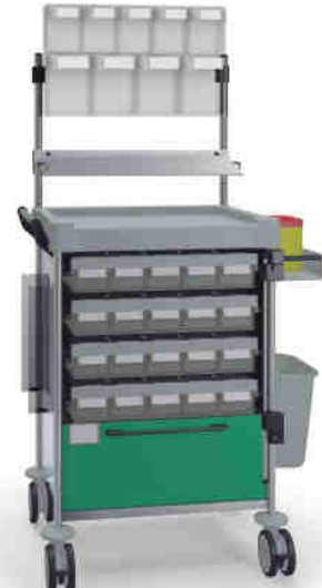
1838 G 116M6 G.26(RA4.A5.R1). 32R.46.50