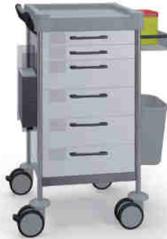
Q106 W SQ161 W.32R.46.50