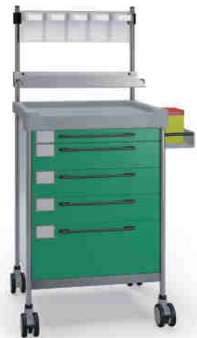
3141 G 365 G.26(RA5.R1).32R