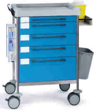
1606 B 165 B.32R.46.50