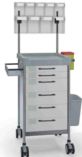
Q064 W SQ061 W.26(RA4Q.A5).32L.33R.50