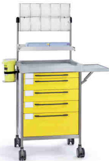
3680 Y 365 Y.26(RA5.A5.R1).30.33L