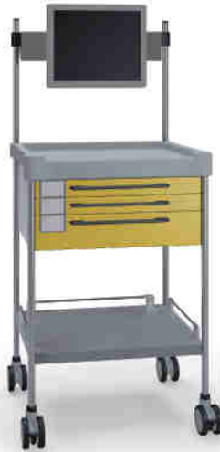
3170 Y 321TX Y.26M(R75M)