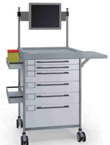
3695 W 362M6TX W.26M(R75M).30.(2)32L