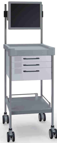
Q026 W SQ021 W.26M(R75QM)

Without keyboard drawer Ilman näppäimistövetolaatikkaa