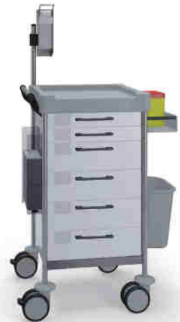
Q112 W SQ161 W.32R.46.48L.50