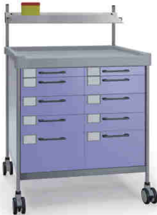
3818 F N365 F. 26LW(R1N)