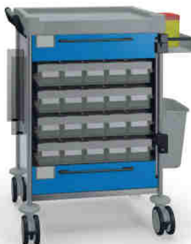
1894 B 114M6 B.32R.46.50