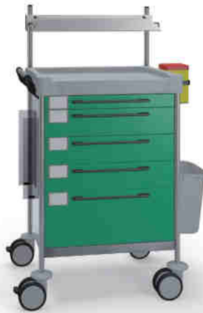
1636 G 165 G.26LW(R1).33R.46.50