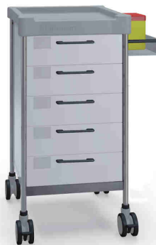
Q055 W SQ065 W.32R