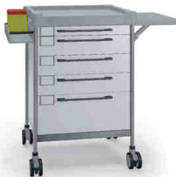
3131 W 365 W.30.32L