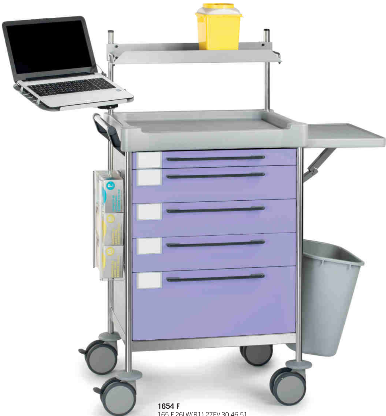
1654 F 165 F.26LW(R1).27EV.30.46.51