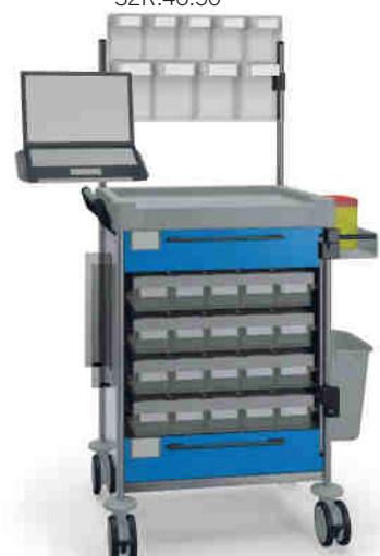
1896 B 114M6 B.26(RA4.A5). 27EV.32R.46.50