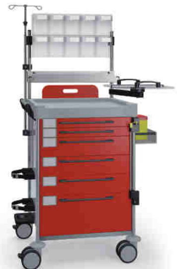
1210 R 162M6 R.12.14.26(RA5.A5.R1). 28EV.32R.34.36.40