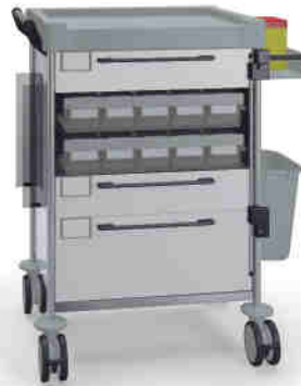
1808 W 108M6 W.32R.46.50