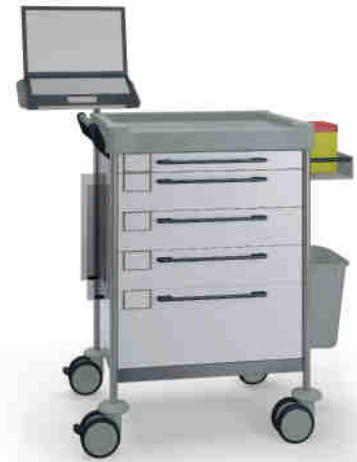
1608 W 165 W.27.32R.46.50