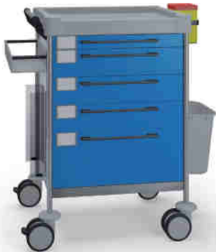
1625 B 165 B.32L.33R.46.50