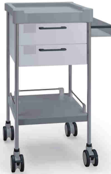
Q025 W SQ022 W.32R