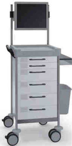
Q186 W SQ161 W.26M(R75QM).32R.50 Without keyboard drawer Ilman näppäimistövetolaatikkoa