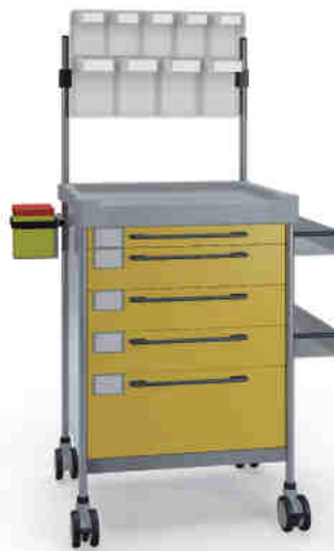
3609 Y 365 Y.26(RA4.A5).(2)32R.33L