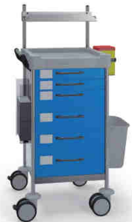
Q136 B SQ161 B.26LW(R1Q).33R.46.50