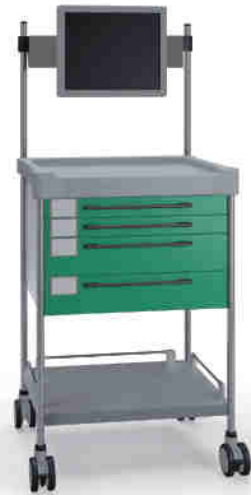
3174 G 332TX G.26M(R75M)