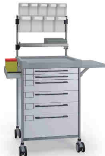
3694 W 362M6 W.26(RA4.A5.R2).30.32L