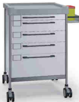
3129 W 365 W.32R