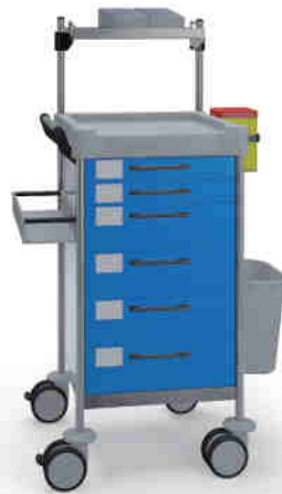
Q128 B SQ161 B.26LW(R2Q).32L.33R.50