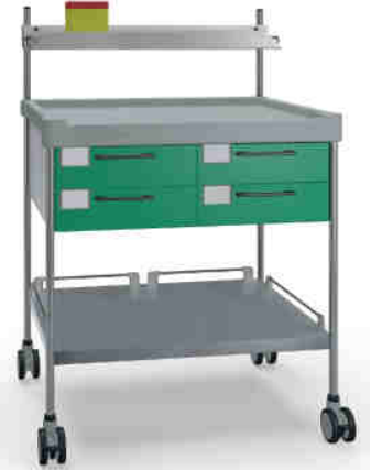
3800 G N322 G.26LW(R1N)