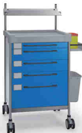
3137 B 365 B.26LW(R1).32R.50